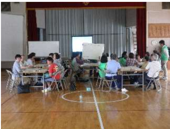
グループが一つの家族という設定で話し合います。

次の、プライベートスペース作りは、各グループの工夫や悩んだ点などが多く感じることができました。各グループ、真剣に話し合い、工夫し、写真のようなプライベートスペースが出来上がりました。皆、それぞれの工夫に関心しきりでした。